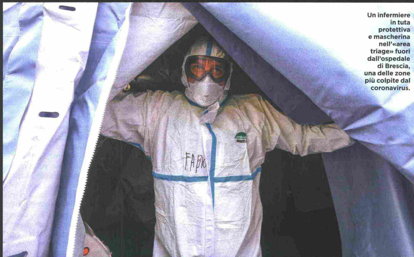
Un infermiere in tuta protettiva e mascherina nell'«area triage» fuori dall'ospedale di Brescia, una delle zone più colpite dal coronavirus.