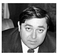
Walter Tobagi, ucciso il 28 maggio 1980

Walter Tobagi fu ucciso barbaramente perché rappresentava ciò che i brigatisti negavano e volevano cancellare. Era un giornalista libero, che indagava la realtà oltre stereotipi e pregiudizi, e i terroristi non tolleravano narrazioni diverse da quelle del loro schematico ideologico.