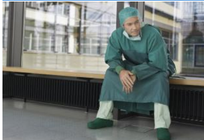
L'SOS dei medici ospedalieri: troppi turni notturni e troppi pazienti da seguire