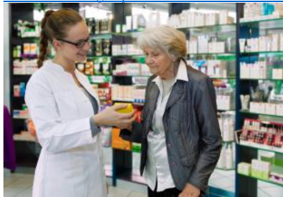
Al servizio sanitario investire sul farmacista conviene