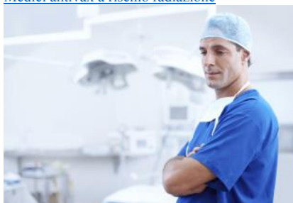
Mai così tanti medici e infermieri nei Paesi Ocse